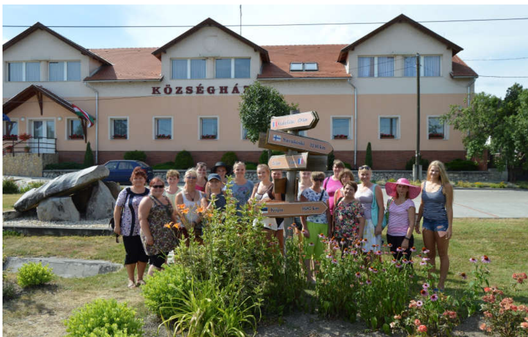
Kõpu delegatsioon Iszkaszengyörgy sõprusvaldade sildi juures

Kõpu valla delegatsioon jõudis õnnelikult koju tagasi laupäeval, 17. juulil.