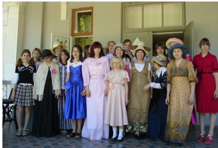
“Unustatud mõisate” toimikond

Lisainfot saab aadressil www.unustatudmoisad.ee